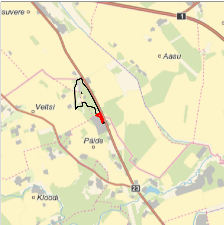
Kaardileht nr 6434 Rakvere